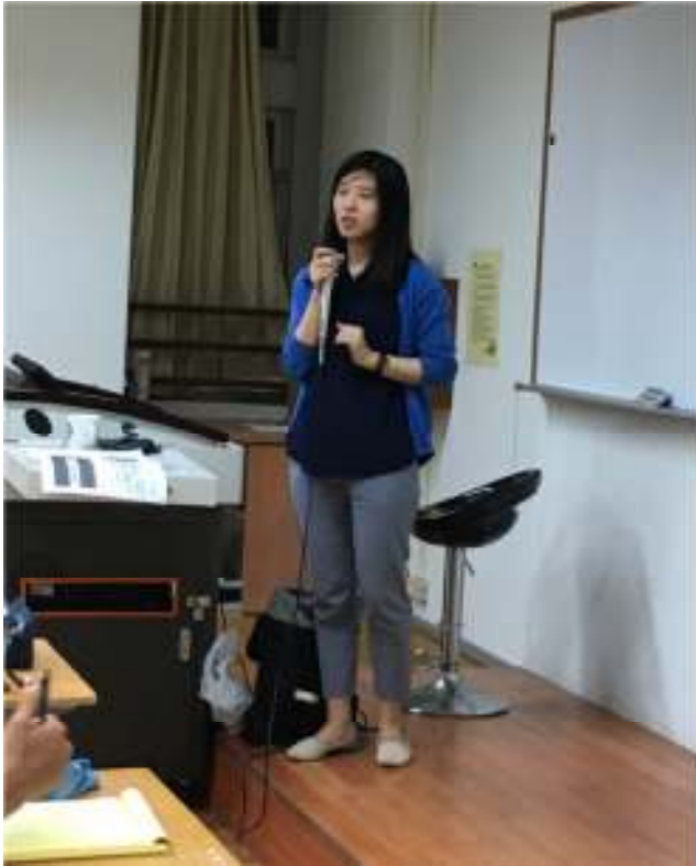
石安伶經理說明調研產業工作內容